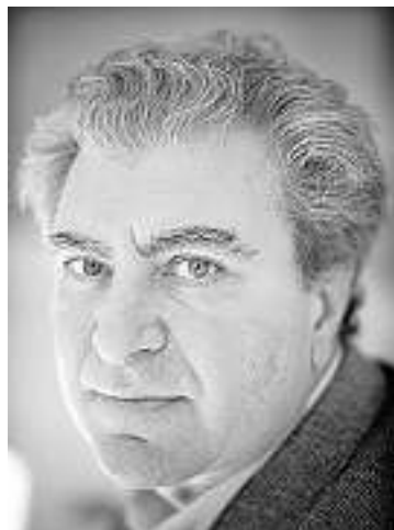
César Antonio Molina.