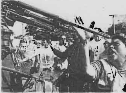
Proxección do documental "Quién dijo Miedo. Honduras de un golpe" De Kátia Lara. Ano 2010. Honduras-Arentina. 110min.

Honduras: 1 ano de golpe, 1 ano de resistencia popular