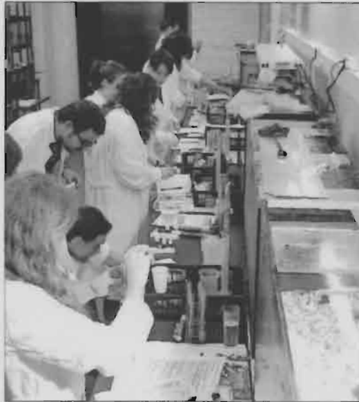
Curso de acuariología en las instalaciones del Igafa.

Desde el Colegio de Biólogos consideran que la acuariología constituye una herramienta muy necesaria en el conocimiento