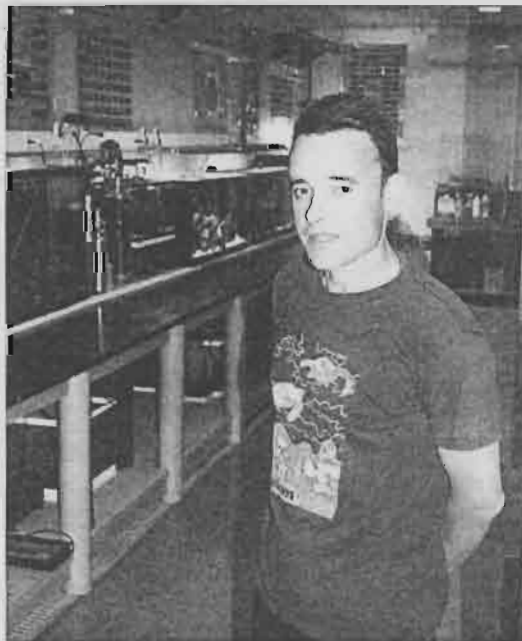
El responsable del departamento

El Instituto Galego de Formación en Acuicultura pertenece a la Consellería do Mar y se encuentra en O Niño do Corvo (A Illa de Arousa). Desde hace un año, este centro cuenta con una sala de acuarios en la que complementan su formación los alumnos, que proceden de diversos puntos de la geografía española, además de servir de escenario para cursos específicos dirigidos a biólogos y profesionales del sector.