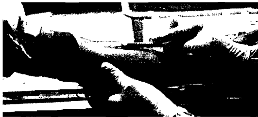
La analítica sustituirá a la molesta biopsia en oncología

El gigante farmacéutico estadounidense Johnson y Johnson anunció ayer que está trabajando con doctores para mejorar una prueba que detecta células cancerígenas en la sangre, para que esté lo antes posible disponible en los centros médicos. El método, conocido como microchip de circulación de célula cancerígena (Circulating Tumor Cell, CTC), ha sido calificado como un avance revolucionario en el diagnóstico del cáncer desde que fue desarrollado por primera vez hace varios años en el Hospital General de Massachusetts.