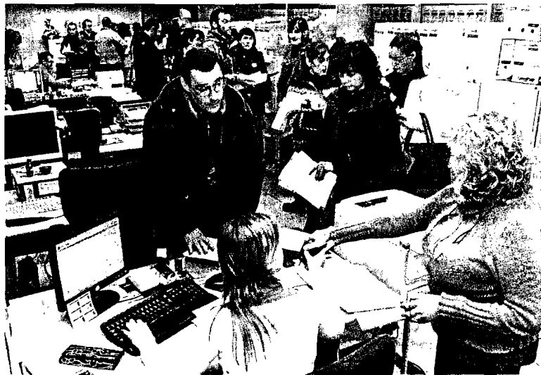
Los veterinarios de Seaga hacen cola para entregar sus denuncias ante Inspección de Trabajo

También consideraron que la fuga de cerebros "se debe a que aquí no existe futuro, ni medios, ni respeto por la investigación".