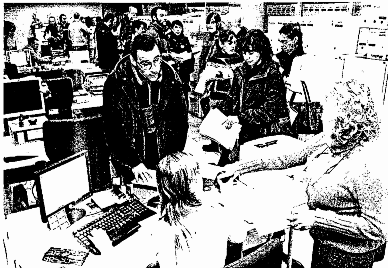
Los veterinarios de Seaga hacen cola para entregar sus denuncias ante Inspección de Trabajo

También consideraron que la fuga de cerebros "se debe a que aquí no existe futuro, ni medios, ni respeto por la investigación".