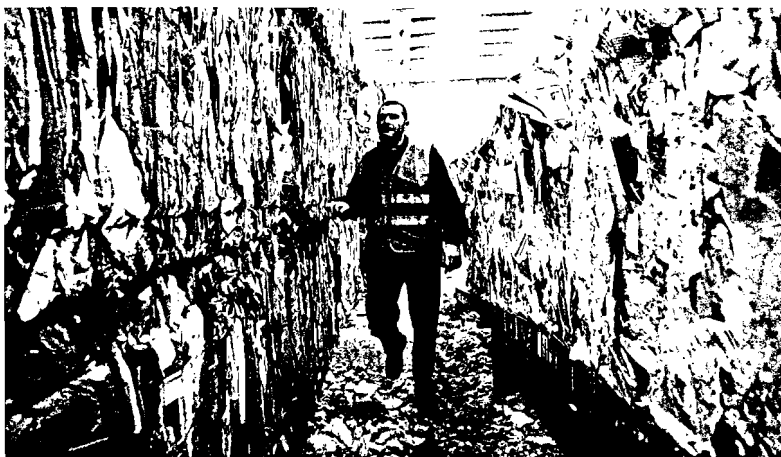
Cogami ofrece posibilidades de empleo en empresas como Coregal, en el polígono de Costa Vella