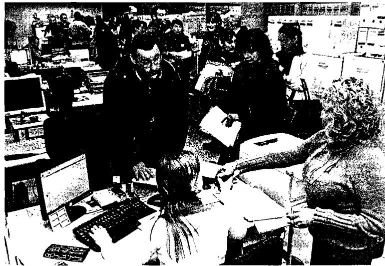
Los veterinarios de Seaga hacen cola para entregar sus denuncias ante Inspección de Trabajo

También consideraron que la fuga de cerebros "se debe a que aquí no existe futuro, ni medios, ni respeto por la investigación".