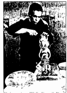
Cortador de jamón.

Por todo ello, instan a la Administración a centrar la lucha contra los incendios en la prevención, con actuaciones orientadas a la "regulación ecológica del material combustible".