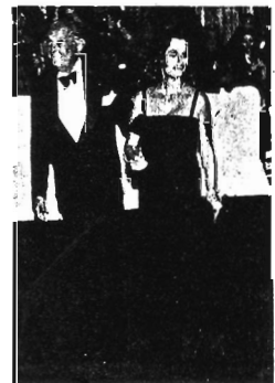
De la Renta junto a Cruz.

Este año ofrece una exposición en homenaje al desaparecido diseñador británico Alexander McQueen. Una de las más esperadas fue la actriz Penélope Cruz, que llegó al Met cogida del brazo del diseñador Óscar de la Renta. Se dejaron ver también Beyoncé, Gwyneth Paltrow y Jennifer López.