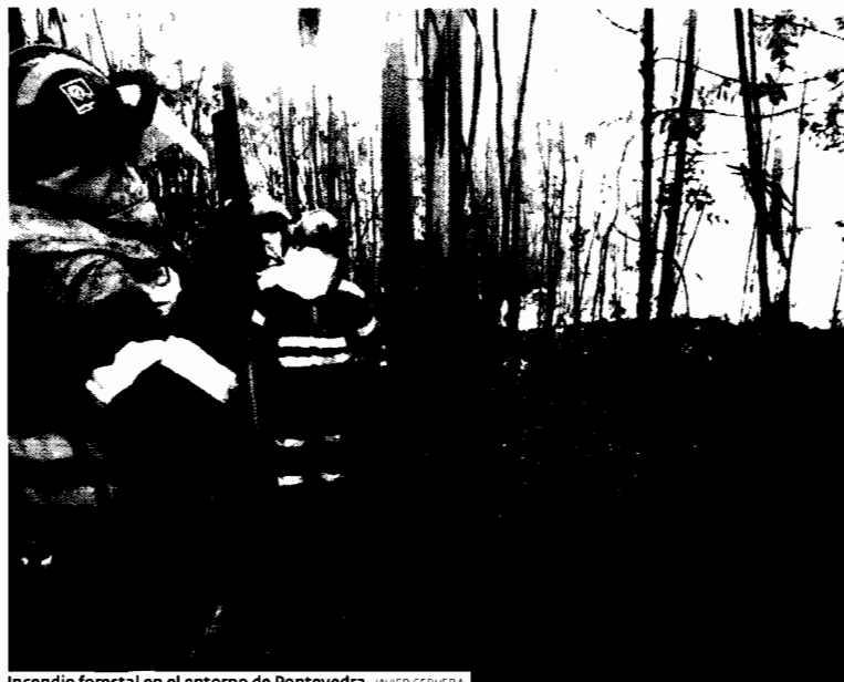
Incendio forestal en el entorno de Pontevedra. JAVIER CERVERA