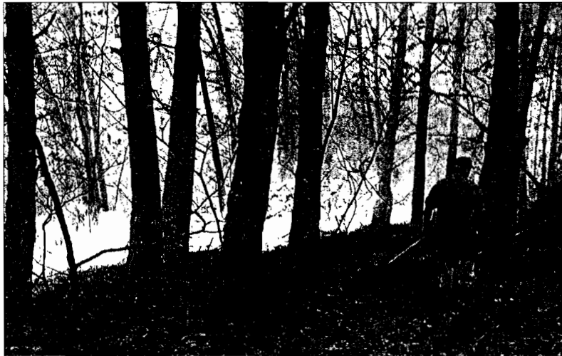
Brigadistas trabajan el pasado 8 de abril en el incendio de Bande que arrasó 410 hectáreas.