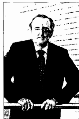
Mariano Barbacid.

El descubrimiento es "importante" porque permitirá el desarrollo de una nueva línea de tratamiento específico para este cáncer utilizando inhibidores selectivos para esta quinasa, según el CNIO, que añade que es precisamente el inicio de la sín-