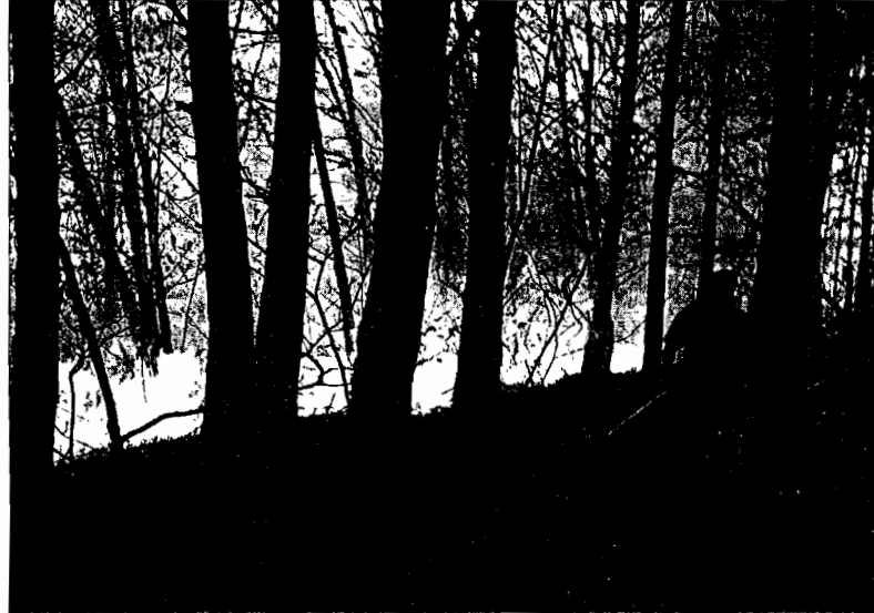
Brigadistas trabajan el pasado 8 de abril en el incendio de Bande que arrasó 410 hectáreas.

En cualquiera de los dos casos, Otilia Reyes insiste en que una década es poco tiempo para devolverle a un monte quemado su estado original y explica que, en todo ca-