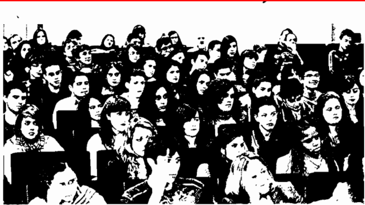
Alumnos y profesores en la clausura de la sexta edición de la Olimpiada de Biología