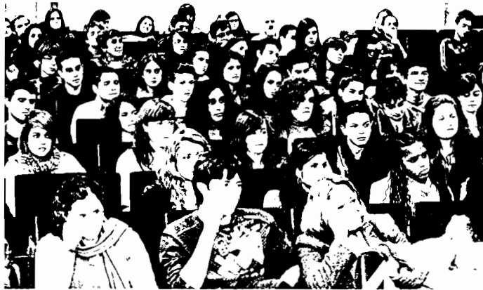
Siete alumnos de la zona se midieron ayer a un centenar de estudiantes de toda Galicia. A BALLESTEROS

Sobre a suba das taxas municipais. «Realmente, as modificacións son mínimas porque, por exemplo, a auga está adjudicada por quince anos e está ligada ao IPC. O ano pasado foi negativo, e a taxa baixou, e este ano é positiva, e sube o 1,8. Está contratado así (...) e no alcantarillado exactamente igual. Entón, realmente, non é unha decisión nova. A decisión xa se tomou cando se adjudicou [o servizo]».