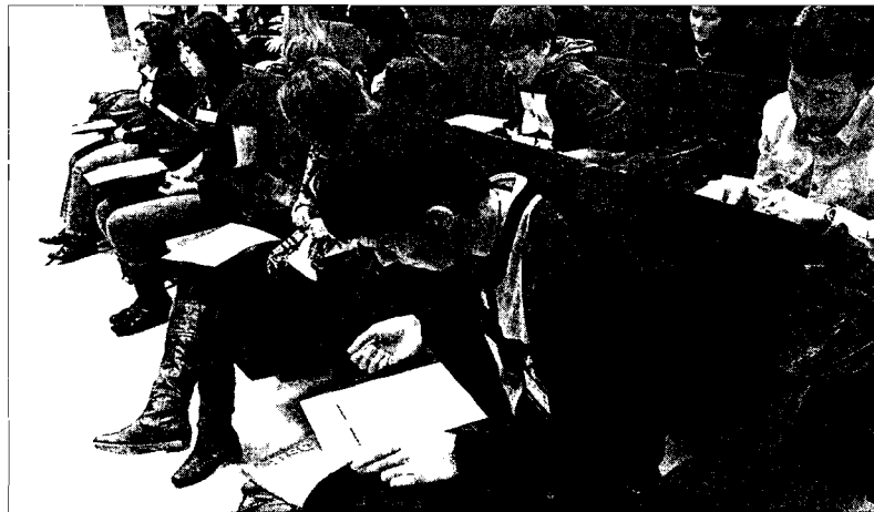
Los participantes en la Olimpiada Galega de Biología durante el examen, ayer en Santiago

Un alumno de 2º de Bachillerato del colegio coruñés Marista Cristo Rey es uno de los tres ganadores de la Olimpiada Galega de Biología