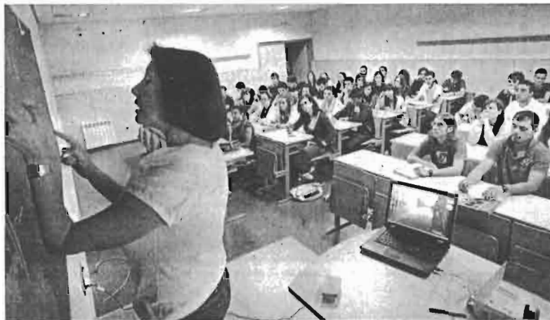
En el primer día de clases de Económicas las aulas estaban prácticamente llenas

Siempre quiso estudiar Económicas y dedicarse a la enseñanza, y este curso tiene diez asignaturas. Lo que más le preocupa es «no dar la talla o que sea mucha materia». En cuanto al