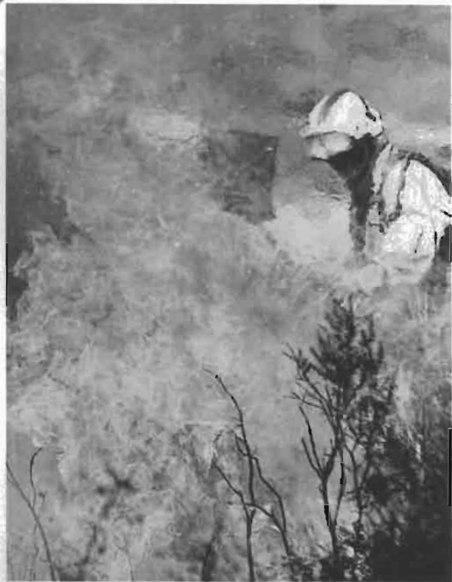
Un bombero apaga un fuego, este verano.

Guerra destacó que los 4,7 millones invertidos por la Xunta en Reganosa han generado hasta hoy 2,3 millones en beneficios