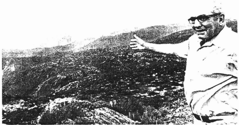
Desolación. Imaxe captada o pasado mes de agosto durante o sinistro rexistrado nos montes de Laza (Ourense)

Un informe de la multinacional Hays ( www.hays.es ), líder europea en selección de personal especializado, señala que en lo que va del 2010 los bufetes de abogados españoles apenas han incrementado sus plantillas; los hay que incluso las han recortado. El descenso del sector en España confirma una tendencia que se inició durante el 2009 en el sector y en todo el mundo, sobre todo en Gran Bretaña, con cientos de despidos, recortes y congelación de sueldos, y descenso de beneficios para los socios.