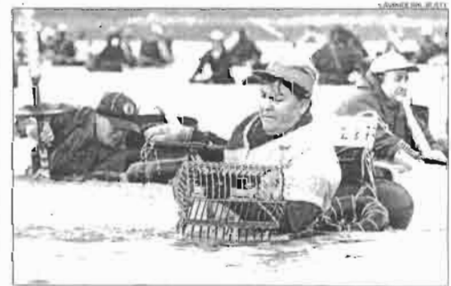
Un grupo de mariscadoras ó berberecho na zona do Testal

dor. En canto ó número de litros cualificados, o Consello Regulador detectou unha lixeira repunta no que levamos de exercicio con respecto á media dos tres últimos anos. Así, o Consello Regulador cualificou ata o 31 de xullo, data do último informe, un total de 164.687 litros dos diferentes destilados que ampara, unha cifra que supón un incremento do 12% con respecto á media de litros cualificados na mesma data dos tres últimos exercicios. ■ REDACCIÓN