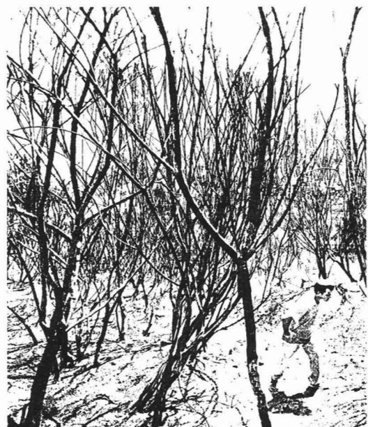
Así quedou o bosque tralos recentes incendios que destruíron parte do patrimonio forestal do Geres, ao sur da «raia», en Portugal

O Cobga tamén advirte de que nas reforestacións deben primar as especies autóctonas, o que obriga a unha preparación de material biolóxico; e engade que debe terse en conta o cambio climático.