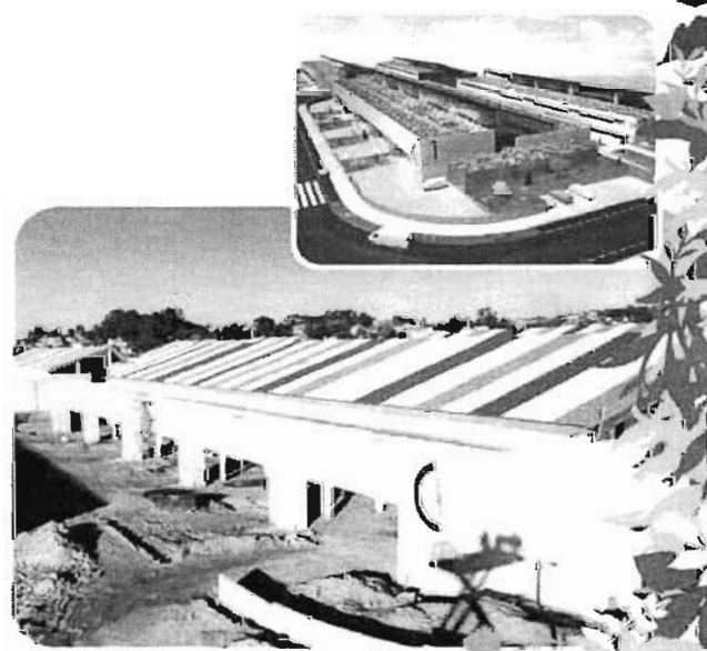
Remate das obras febreiro 2011